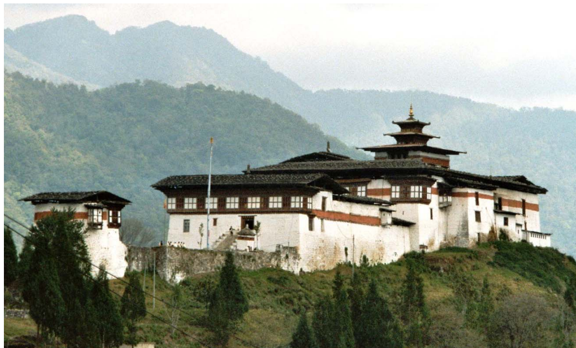
Le Dzong de Dagana, siège de l'administration provinciale

niveau local n'était pas prévue au départ et a été ajoutée pour tenir compte des besoins importants des premiers responsables locaux élus en 2002. Initialement prévu sur les années 2002 à 2005, le projet a effectivement démarré en 2003. Le budget total est de 2.5 millions de francs suisses. La direction du projet - assurée par le Ministère des Finances - a utilisé ces fonds de manière parcimonieuse, ce qui permettra de le prolonger jusqu'en 2006. Au total, ce