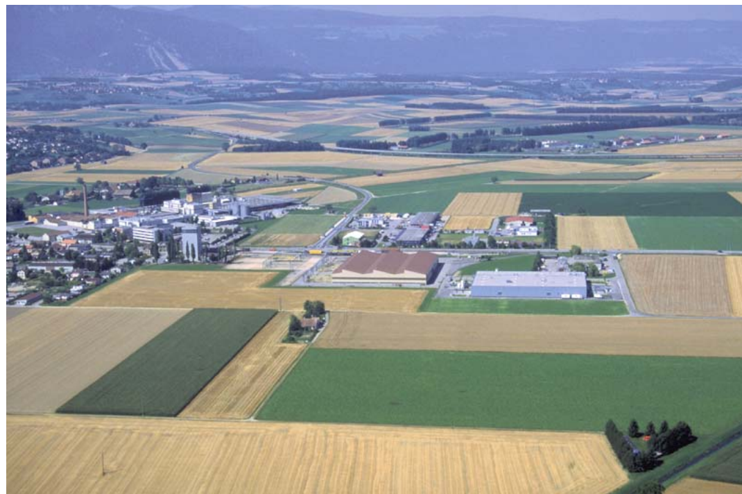
La Plaine de l'Orbe

La démarche d'élaboration de cette stratégie est conçue comme un processus. C'est le résultat d'une concertation et consultation entre les acteurs publics locaux, régionaux et cantonaux et privés. La volonté a été clairement affirmée de mener une réflexion qui favorise la discussion, réservant ainsi la souplesse nécessaire pour faire face aux demandes et à l'évolution des projets en matière d'aménagement du territoire de manière flexible. La mise en oeuvre repose sur un dispositif de concertation au niveau des entités géographiques (collaborations intercommunales accrues), qui peuvent fonctionner selon le principe de la géométrie variable suivant les problèmes à résoudre.